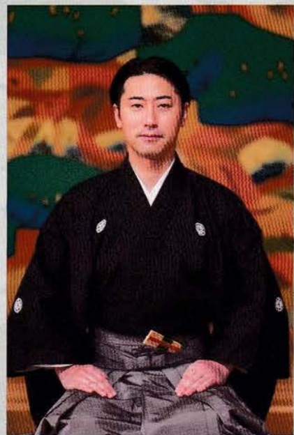
十四世 林 喜右衛門