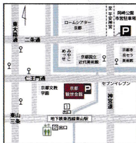
京都観世会館案内図