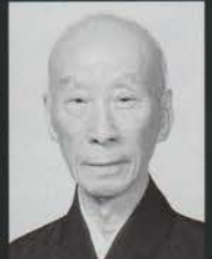
観世 恭秀 Kanze Yasuhide